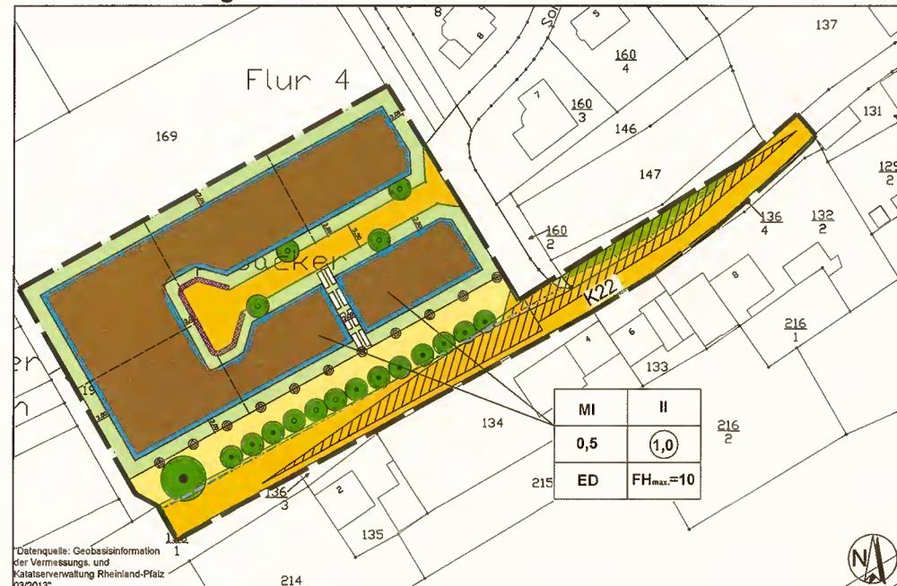
Ausschnitt Planurkunde Bebauungsplan „Kappesacker II“, Auen (unmaßstäblich)

Die Planzeichnung bleibt unberührt und dient ausschließlich der Übersicht.