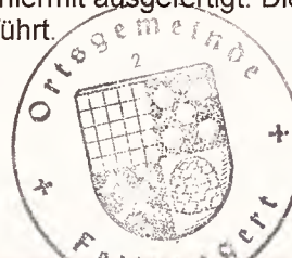
(A. Gonschorek) Ortsbürgermeister