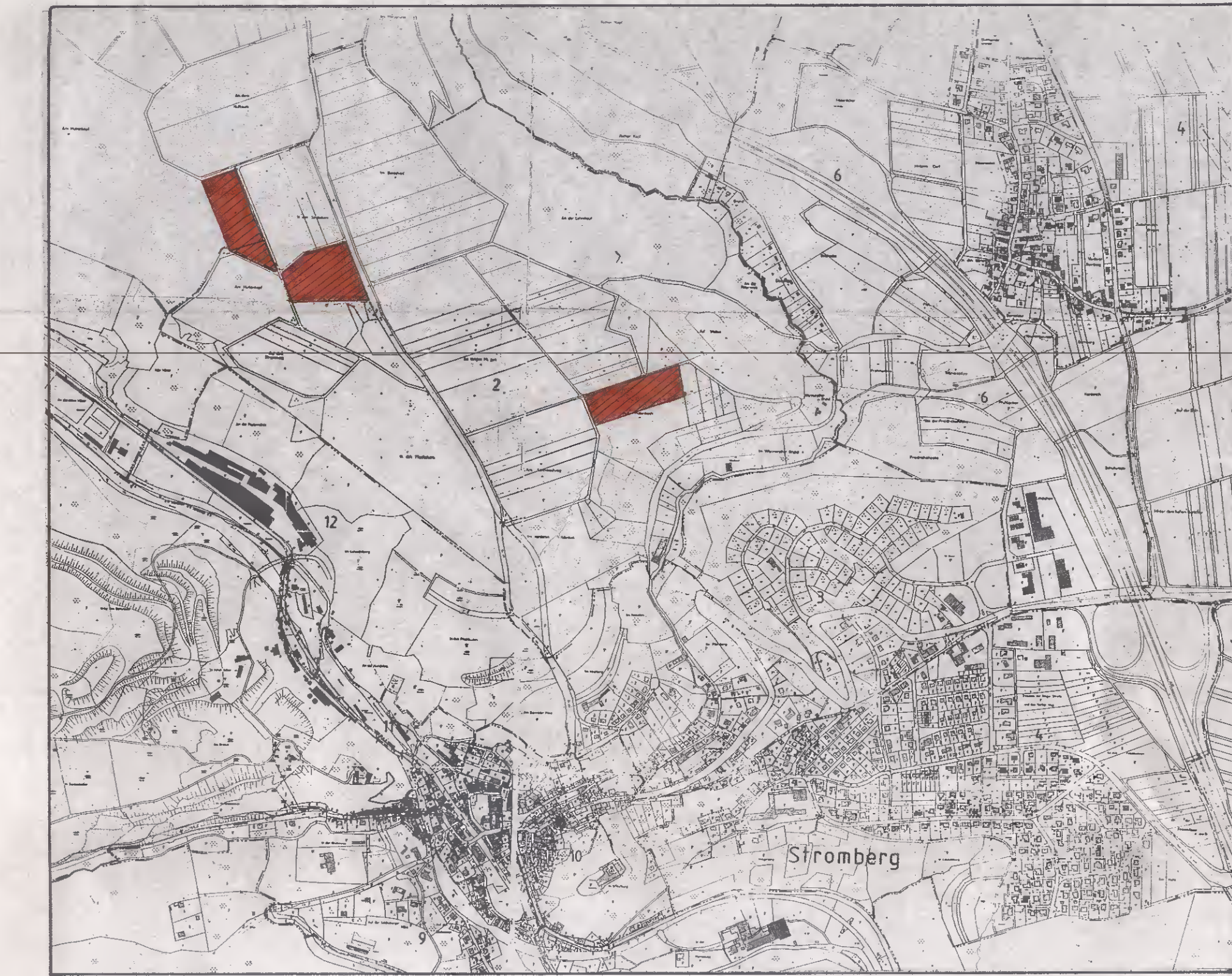
Übersicht: Lage der Ersatzflächen und Fläche für das Ökokonto M 1 : 10.000

VERFAHRENSDATEN Der Stadtrat Stromberg hat am 21.01.1992 die Aufstellung dieses Bebauungsplanes beschlossen und am 11.09.1992 ortsüblich bekanntgegeben. Die öffentliche Darlegung und Anhörung des Bebauungsplanes als Vorhaben der Bürgerbeteiligung wurde am 27.04.1992 durchgeführt. Der erste Entwurf des Bebauungsplanes mit Begründung hat auf die Dauer eines Monats vom 25.11.1993 bis einschließlich vom 09.11.1993, öffentlich ausgelegen. Der Stadtrat, Ort und Zeit seiner öffentlichen Auslegung sind am 19.11.1993 ortsüblich bekanntgegeben worden. Der zweite Entwurf des Bebauungsplanes mit Begründung hat auf die Dauer eines Monats vom 28.04.94 bis einschließlich vom 19.04.94 öffentlich ausgelegen. Der Stadtrat, Ort und Zeit seiner öffentlichen Auslegung sind am 22.04.94 ortsüblich bekanntgegeben worden. Der Stadtrat Stromberg hat nach § 10 BauGB am 23.04.1996 den Bebauungsplan, bestehend aus der Planzeichnung und dem Text, als Satzung und die Begründung zu dem Plan beschlossen. Gehört zum Baubereich vom 22.08.96 Az. 42-10-10/96 Wegen die Satzung werden keine Bedenken wegen Rechtsverletzung i.S.v. § 11(3) BauGB Krügerverwaltung Bad Kreuznach [Signature] Meiborg Lfd. Kreisrechtsdirektor [Seal: Kreisverwaltung Bad Kreuznach]