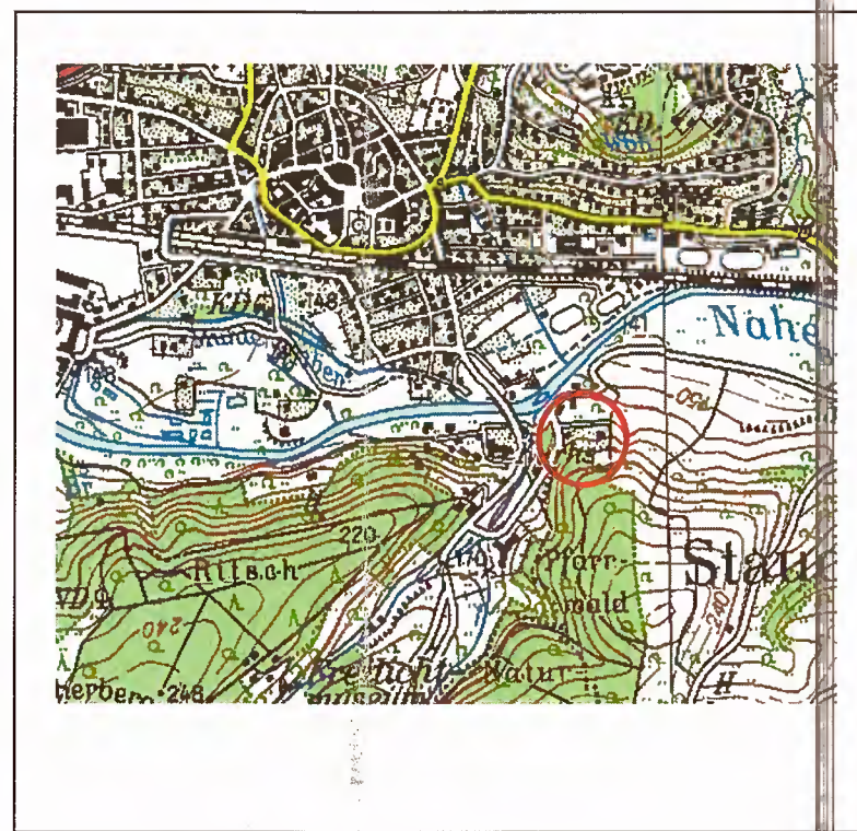
Lage des Geltungsbereiches (Auszug aus dem Top50 View, LVermGeo Rheinland-Pfalz, unmaßstäblich)