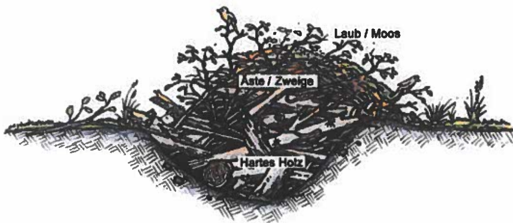
Schematischer Aufbau eines Totholzhaufens

Hinweis: Es empfiehlt sich eine Anlage in den Randbereichen, um eine bestmögliche Pflege der Wiesen zu gewährleisten und hier keine Hindernisse zu errichten.